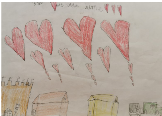
Paolo, Bourbach-le-bas, Haut-Rhin