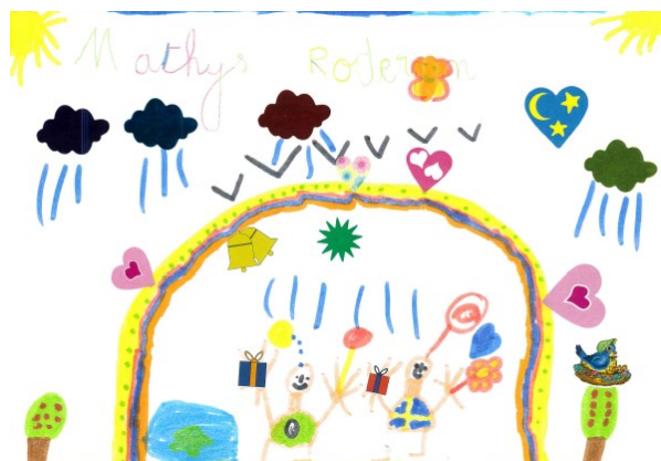
Mathys , Bourbach-le-bas, Haut-Rhin

Mathéo , CE2, école d'Innenheim, Bas-Rhin